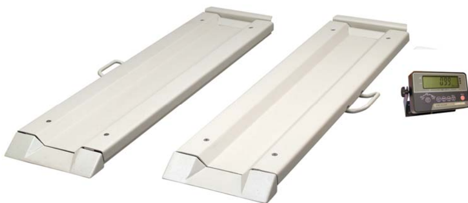
Vagnvåg WPT/8B 250C